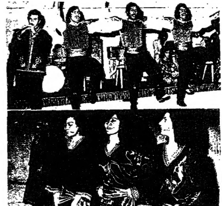
رقصة بركة: افتتاح لبناني

مع حرب تشرين 1972 ازدهر الحديث عن «الامر» بدل الحديث عن الهزيمة، واجتاحت المسرح العربي فكرة الاموال المتنازل لكن المسرح الرحباني على عتده كما هرب من الهزيمة هرب من «الامر»، وكان نتاج الهروب مسرحية «الولو» التي عملت بمسألة «الحريه» وخرجت بالاستنتاج العمي العيني الثاني على لسان فيروز: «الحرية» كنية والعدالة كرتون». بينما كانت صباح لها غيرها» تخرج من اطار المرأة المتداعية لتصور العلاقة بين المكة والشعب في الستينيات، التي رغم دواعها الموروثة في الفن الصياحي، شككت لأول مرة مناقسة جديّة لسر الرحبانية واعطت بداخل تجارة ارفع وذلك لان التراجيح اللغزانيا من البرجوازية الصغيرة اكتفت بان رفضت فيروز على قاعدة ادراك واسع لاعتماد فيروز عن الواقع والنجاة الى صباح لان الخيار بالنسبة لها لا زال بين فيروز وصباح، وقد عمل انهار فيروز في هذا الوسط لخدمة القاتية بشكل الي.